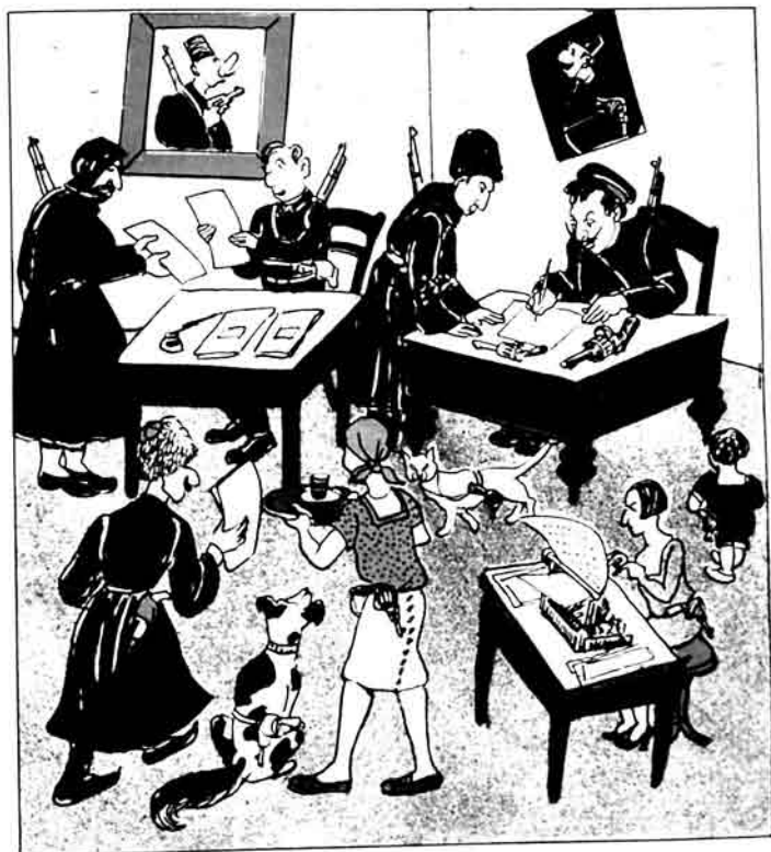
Zakatalada xidmətçiləri slah daşımaqda ayrı-ayrı lap əoriny çəkmişlər.