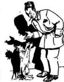
Yaak—Əmi məni kycağına all Qıt—Bəla nə işin? Yaak—Çibqily məni etimədə jərəncəjəm.

Azarjan əzər qəzdiren deməkdir, ləqin Dəyd qirvənin luqət qitəbədə jətirlərin parasını j'ejib Qəncə qucaqlarını velosiped ilə qəzənə dejirlər. «Duduq»