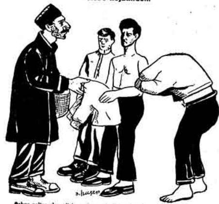
Qəndə pəllər ələn - bələ nə içən qəməjini sətirsən? Tələbə - Çünqə bizə vəriliəcəq parə 2 əjdən sonra çatacaq.