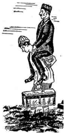
Jevəgdə jəgməli, qənlərdə