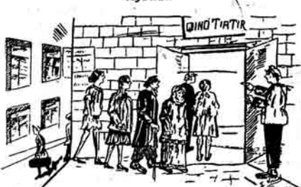
Kybyl müdiri Zəzək bütün köhymlərən, hər dəfə qinoja konak edir.