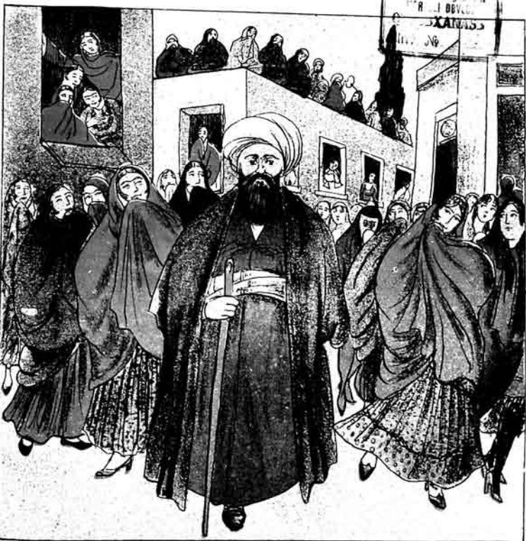
Axynd aejx hazretlari, jaxyd Jysifi Zəmana.