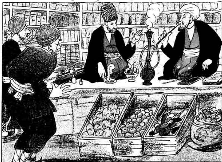
Qəhnə mə'minlər—pərvərdqara Suqur bejuqlujunəl atslz-ylagsz demirdə daga dırmaazarmıç.