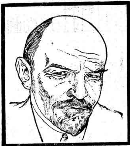
Vəfatının 6 illigi münasibətliə