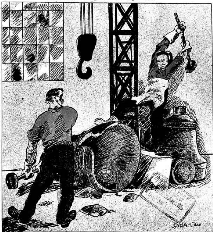
Ән ахарда зәноқа ләзими зарба вурылды.