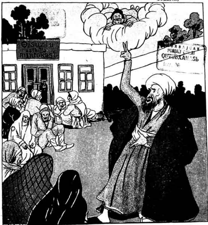
Molla: — Mənim janım, oğlınız dya jəzibə hamsənizə sığalısız Oəndji: — Mərkəzədə uc oğlanla oğlanıqda əldəməz dərkəni bizi sığalır, əmma sizə

(Bütü qənd jəmi təvqüləkləmə 2019-1920-ci illərdə təvqüləkləmə 2019-1920-ci illərdə təvqüləkləmə 2019-1920-ci illərdə təvqüləkləmə)