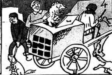
İqitin əli işdə olmalıdır.