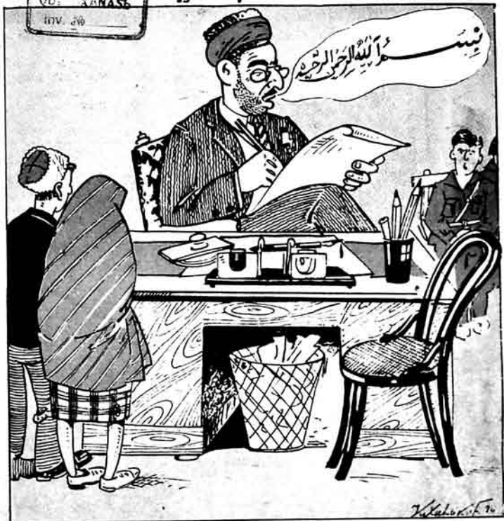
Şəxsi kəyjdat şə'bəsi (Zakas) mudiri Gənəl dajı, bismillah deməmiş bir işə başlamaz.