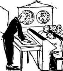
Bə'nəsi muallim qəvər bir tələbə əhlədə jətdir, on - nən məvət - ləzək' mə - jəsədə bərdən kətklər: əbej muallim mən byradəjəmə dejił. Dəmə tələbə jətsəmə

Bir qun məqbət mudiri mu'al-İmdən xahiş edir qı, statistik için təsvivi vərəki də olan syvallara cavab toplaşın. Müallim vərəkəni aləb sənflə daxil olar və işə baş-ləjərlər bir sağırdən sorşors: «dəsn nə dur?» Sağırd qimin - mə-nim? Muallim əlbəttə sanit! Sa - qird: Nəcədir? Muallim familjan nə dur? Sağırd qimin, mənim? muallim akləb bir syratdə, əlbəttə sanin, by nə syvalard hər səfər və rirənt? Sağırd əqlid. Muallim nə-çə jəqsə var? Sağırd qimin, mə - nim? dediqdə, muallim bərq hirsə nən. «jək mənim!» dejił. Sa - qird soylə kənləhk ilə «sizin muallim ja kərk ja də kərk işi jə - şənsə olar» dejił. Muallim sağırd - ın by cavabından kəjə qəlib onı sənəldən çəkənr. Mudir muavinəsi by ysəgə dərs zamanı dəsnərdə qərib səbəbləri sorşyr. Sağırd əhvalətə nəqəl elədiqdə muavinə qərar qı, sağırd byna qəz vryyr, əkləkdən bərq çəbu - rə vny muallim oduşnə aparəy, təhmət etdiq bir zamanə mudir qəlır. əhvalətdən muxbir olar: əz