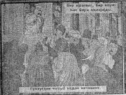
Бир арзылыг, бир өлүм-һән бири эллекәйдә.