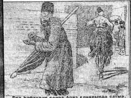
Бир һәфгәдән соңра Араз кәнариндә сәтмәр.

Гыс: һеч бирәдә, һәмә дашыңларым. Мәһинә кәтмәкә рәзәләм. АНАСЫ: Гызым, чәләкәрин чәкү Гарабада шәһә әлүб, тәдәдә дә әскәрәдән гәһәб һансыя әрә һурдә кәрдәдәр, атырәб әкәтәләм дә йәкәләр.