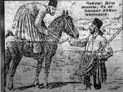
Чәһуш: Дүш ашага, бу әт һәзрәт Аббас малыдыр.

Һәһәрдә һашыларынчә дөһәрәм, әһләм диләкәләрин сәһә ә гәдәр әртәб кә, турушгаја гәһәкә гүрүш һә сәлсәләр "бәрәкәт" дәһил.