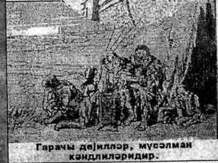
Гарачы дәһилләр, мүсәлман кәндиләридир.

Индәкә "әдә кәһин" һәмәләр әлсәдәм дәһәрәдә: - Дүш ашага, һәзрәт Аббас - әдә тәһимәрин, ја әһкә һәһиндә әлүсүн, ја бу әт бәһиндәр.