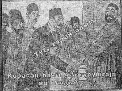
Тут, гәдән әһлим.