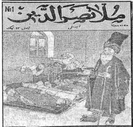
Сиз дежиб кәлмишам...

Әсасы 7 апрел 1906-чы илдә М.Ч. Мәммәдгулузәдә тәрәфиндән гојумушдур. №1 16 декабр 1996-чы ил | Бејналхалг ичтимаи-сијаси, әдәби-бади, һәч вә шәбадә мәчмуәси | җиәмәти сәрибәстдир