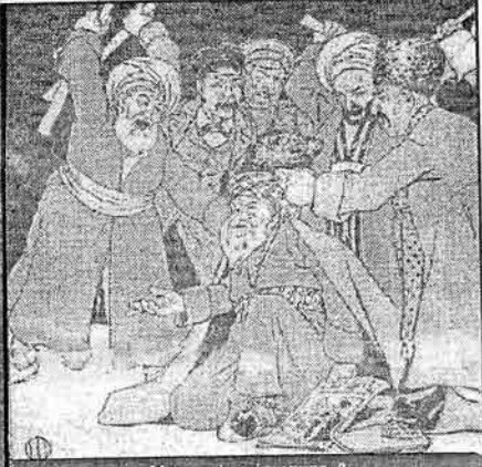
Мәшә шижә дојурсунуз...?

... хоп кәлиб, бизә сафа, өзүнә чәфә вә әбади шәһраг кәтирдин, устад!