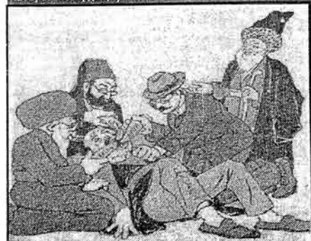
А) гәрәшләр, мән ки, дигәнә хаг олунаммишам, бу диләри ағзимә сохурсунуз.

Вәллаһ, бизә даһә чох дејурләр, усталик тутуз "бармаглыглар" да салырлар, Молла әми!