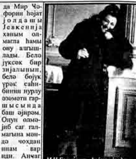
M.Ч.Багировун һојат жолданан М.Ч.Багировун жолданан