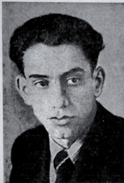
“BAHAR” kitabından - 1950