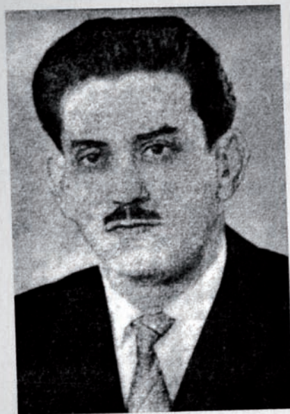
“SEÇİLMİŞ ƏSƏRLƏRİ” kitabından - 1961