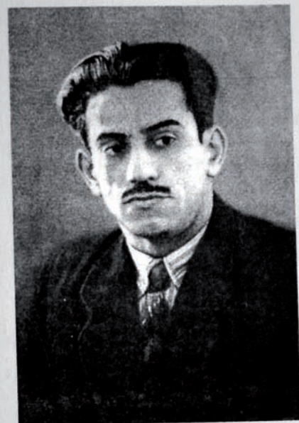
"CEYRAN" kitabından - 1957