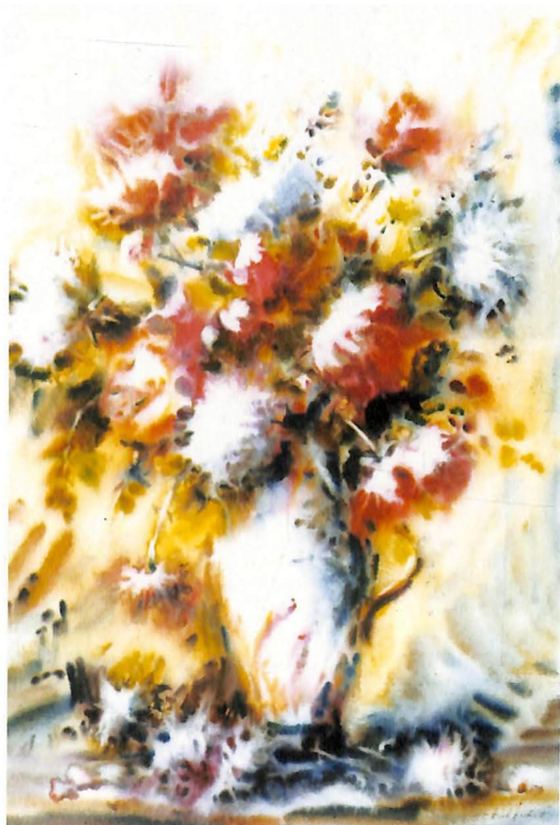
Əbülfəz Fərəcoğlu: "Bahar" ○