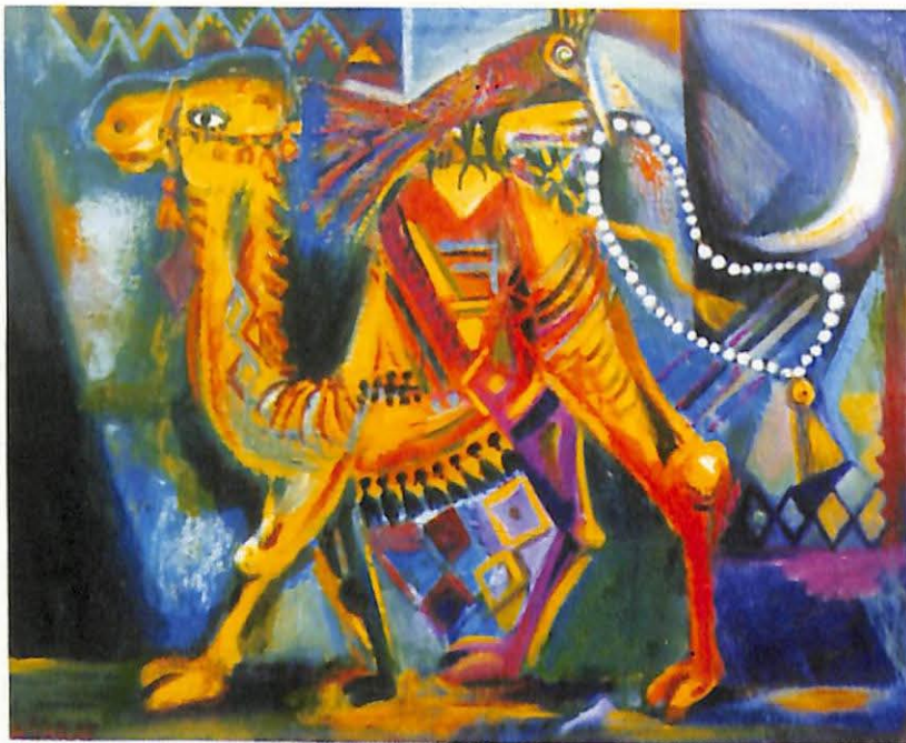
Əşrəf Heybətov: "Karvan"