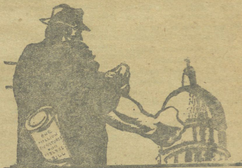
I Ş C I — Sənin qəqun qəsiləndə