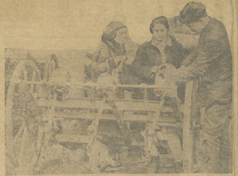
MAŞYNLAR BAZ QƏNİNƏ HAZIRLAJYRLAR.