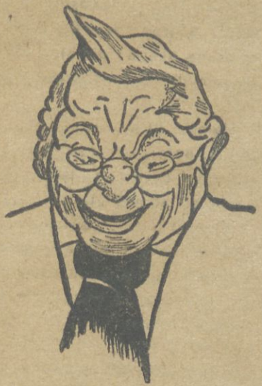
PARIS KOMMYNASININ ÇƏLLADY TƏJER.