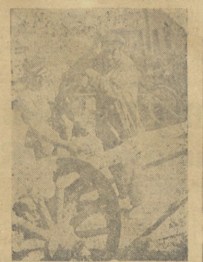
Traktorlar çəçə çəkməyə hazır larylyr

İnkılav bejuq gəzətesindən „Dejli telgraf“, bəş illiqimiz bərədə jazdıy məkələlərdə kəjd edıyqı, planlarıy mıvəffakijət lə İleri aparylmıqdadıy. Gəzəte sonda jazır, „Sıyalar İttifak ının by tərəkisindən Avropa devletləri kərməly və İleride sıyaların bejuq İxracatı qəze alməly İrler.“