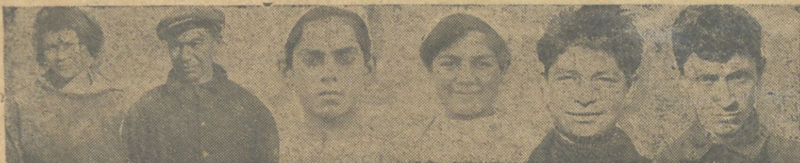
QƏRƏQ ZAVODYNYN ƏZRBÇİLƏRİNDƏN BİRGYRYP

zəhmətləri dir. "Misxana," mis mə'dənləri üçün nəzərə alınan işlər təsbəga surəti ilə ilerilə-jir və biz məksədlərimizi tədbir etməq üçün əsanlıqla əxsətəşifə etməliyiz.