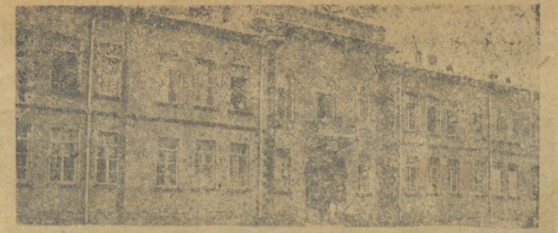
İrəvanda jənı İtqılmış Elm. mərqəzi fırkə məctəbinin binası.

„Kəzyı—Şəfək“ gəzətesinin 5-ncı nomrəsində əmələ faqıltəst tələbət Məmməd Rəhımə fın seqər satması həkkinde çap edilən məkələ, əmələ faqıltəst komsonel əzəqinde təhkiç ediləreç, joldasıñ həkkinde jazylanların dıy əlməçy məjdanı çəkməşdır.