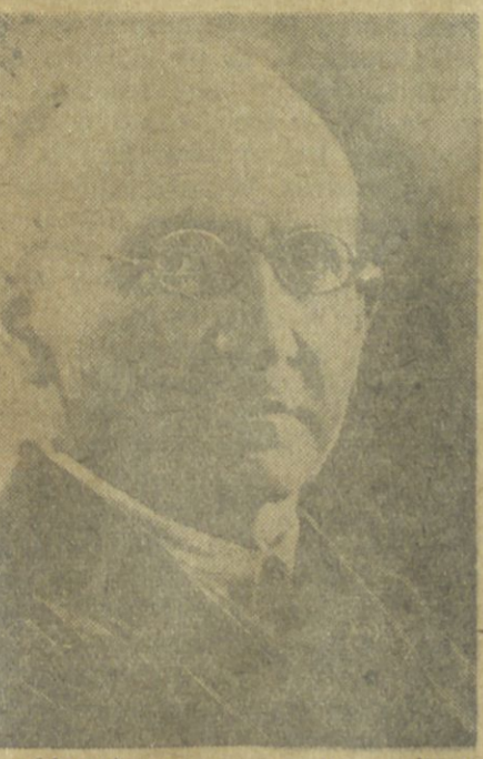
«Almast» operasının qompozitoru ALEQSANDR SPENDIAROV