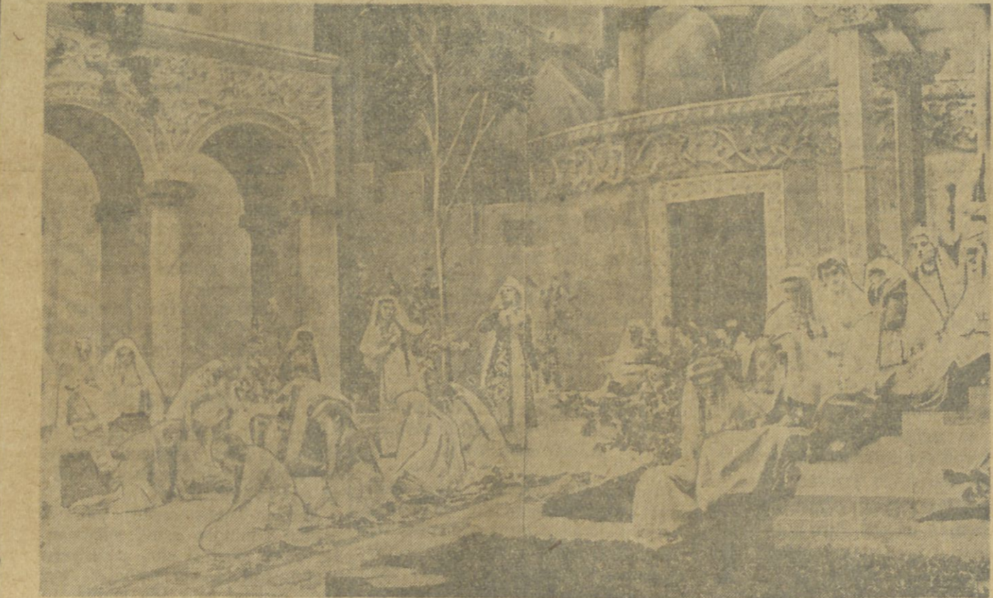
Şəkildə: «Almast» operasının ik iinci aqtdan bir gərymşy