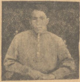
یولداش علی علی یف

یولداش علی زنالوف ارزدان ناحیه سی تورک گنجار تعلیماتجیسی