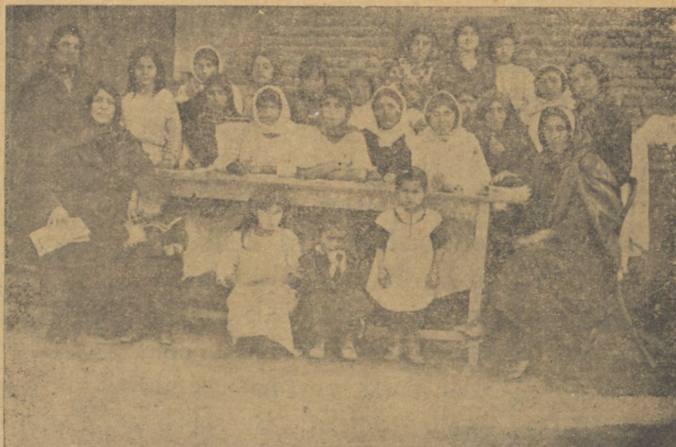
سوادسزلىقى رفع ايدن منطقه ده ايروان تورك قادينلرى.

اودر كه هر بر بيوك كندلرده قادينلرله مخصوص قادين قلوبلرى تشكىل ايتملى بىز.