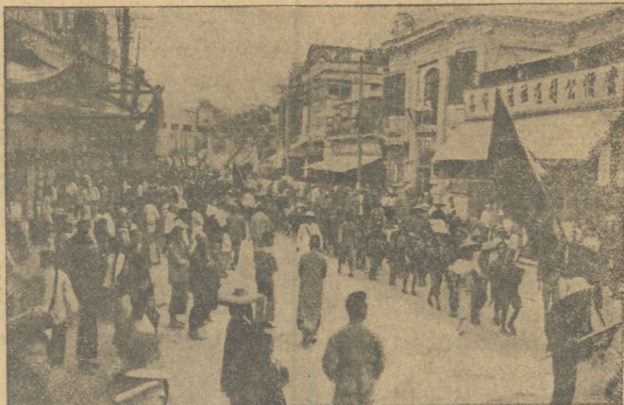
شانغىم ايدە ايشىچىلر نەمەشى.

قاتونك مىلى انقلاب اردولرى نانكىن شەرىنە ياناشدىقلىرىندە، ھىمىن شەردە بولونان چىن عسكەرلىرى چارشمە وقوعە كەلمىشدر، چىن يرلى عسكەرلىرى شەرى براقوب قاچاركن ھوادە شىمدى آتش ايتمەك باشلامىشدر. بو اتادە بر انگىلز عسكەرى وورولور. اجنىلر شەرى ياقىن بر تېمە يىفشوب كىتمەك حاضرىنى كورورلر. دكزدە دوران انگىلز و آمريقا خرى كىلرى اوز تېمەلرنە كويا يول آچماق بەانە سىلە نانكىن شەرىنى توبا توتارلر، بو سېىدن شەرى بوبوك قىسمىلە خراب ايدىلوب، يانغىنلەر توتولمىش يانمىشدر.