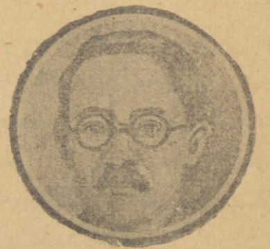
Jevkəni çen Kanton həqumətinin xaricijə naziri.

zırlıqi, qəururlər. Dənizdə dyran inqliz və amərikan hərəb qəmiləri əz təbəələrinə quja jol açmak bəhanəsilə Nanqin səhərinə topa tytarlar. By səbəbdən səhər bəjuq kismilə xarab edilib, jangınlara dytylmyə janmadadur.