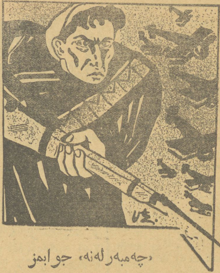
چه مبه رله نه، جو ايمز

قواپه راسيون دائرهمز 4-5 بويوك كندلردن عبارت اولوب بويوك نروت و نفوسه مالكدرلر. بو كند لره كندلى كئله سى بزه كومكچى اولار سا سوز بوقكه قواپه راتيفمزل هر نقصانلارى آرادان كوتورومكله