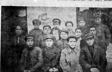
Musavirəyə İstiraq edənlərdən bir gryp

Kəfan dairə pionerlər bilyosı tərəfindən fevral əjınun axırlarında turq pionerləri və dəstə rəhbərlərini İntixab İstəviriəsi qəçirilmiş dur.