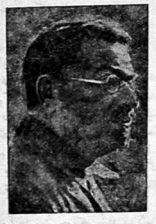
زاقاقلسیا خلق قومیسارلار شورا سنک صدر معاویله تعین اولمش صاقق هایاروسویان یولداش

۱۹۲۰ یامق اکین ساحتی ارمنستان ایچون ۲۰۰۰۰۰ دبیانتین تخمینی اولمشدر. ایروان قلسای ایچون ۴۶۵۰۰ ایچون قلسای ایچون ۸۰۰۰۰ نیری قلسای ۱۰۰۰۰۰ دوزلاکوز ایچون ۱۵۰۰۰ دبیانتین. باز اکین قاناتیاسی تشکیل ایتمک ایچون مقق شورالی جمهوریتلک مرکزى اجرائیه قومیسى و خلق تصرفات شورا سوقالده مؤکیل یولداش سورون زاقاقلسیا فوقالده مؤکیلی اول یولداش بایقوف عین اولمشلادر.