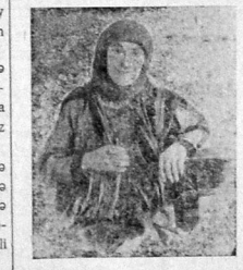
Vədi basar nahijəsinin Əqrəvan qənt syra sədrə Ummu joldas.

Hər bir qəntin kəmsomol əzəqı və qənt fəktə bir həftə dəzənəqsəstə jəpməqə aparmaldır. By həftə zərində məcbürly syratdə qəndin həmti toxymaları dəzənəqsəstə edilməli dır. Eynyn ucun bir kəzə bytıkya formalın lazımdır.