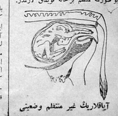
آتافلاک غیر منتظم وضعیتی

بو منتظم وضعیتلی قانقی آتافلا دو ایشک بر کیریومه باغی حمله قانقیلی باغش باغ و سول طرفه و یاغش او باغ طرف ایشکی اولدیگی زمان و یاغش اولور، بویله هر حال فوئدنه ایه دغلی بر سورنده حمله طرف اوزاداران قوتی ویر کیری سولمک و سوگرا یاغی دوغریودر اوتافلا اوزرینه قوسان و بو سورنده منتظم برحاله قوسان لایمدر.