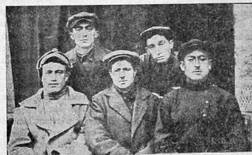
E. L. K. Qj. Ittifaqnu 5-nci kryltaj numajendalarindon bir qrp.

Badan terbijlesi, ojnylar, tamiz havada qemq islari ile mesgali ol-mak cimmaq va gejrj saglamlik tedbirlorindon duzqun bir syrdehdə