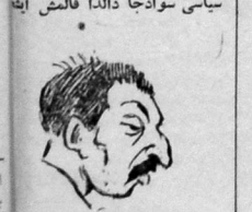
سیاسی سوادجا دالدا قالمش ایتنه

باق اسکی چیچه کدر، برده سوت هج کیمه بوئی، ایدمدر، اداکار گنج قلدن بو شیر، اداکار آبدی سولمیان، ای گولر چیچک «فریمان فخری»