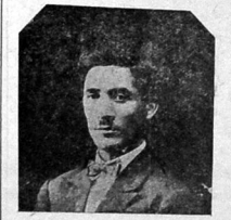
مخبریهک یوزدن ج. سیدلی

مخبریهک یوزدن بولداش سن. شیرنوئی تبلیغچی بولداش سفر و فواریتف مدیری بلیمهک مدینه خبریهک محکمه جوقولار و غزته آدومندن او ننگ آدی و فالیسی طلب اولدی. فرقه آذربایقا جایشان مخبریهک حقو قی منامه ایلهجک غزته مزده یازیلان خبری مکولارینی بولایاجاق و قصلالارک آذربایق فالدریلماسی ایچون واسطلار تکلیف ایلهجک برده مزیه «مخبر» فرقه خلیا جیبی خبریهک محکمه ویریر.