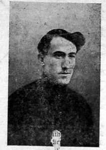
غزته مژک توزیعات شهساک مو کلر شعیسی مدیری بولداش غازیان

آلتیلاما دی. بوتگده فرقه «زلمیش» قومونیشتری فرقه، یالتهوزیک روحنه یانیجی عنصر اولراق تالیر حاق تانداندا ۱۹۱۰-۱۱-۱۲ فرقه ایتمده اولراسا او فرقه آلتیلاما، فرقه ایتمده و اسلام علی حایا آلمای تکلیف ایدر. بولراک هلموسنی فرقه تلماجیبی بولاش سفریک و او ننگ کیلرک بایتا سالیق ک عومو زخمینیزک قصلالار و سوه طرفرینی دورولمه بیلک، عین زمان کشیک کلنی بو ایشه یانک اینشک ایچون خبری زحمت لرینه و اونک حرکاته جنی یازیلان، خبریهک یوز زخمینیزک بولاش اینشک اولاراز رهلیک ایبدو بولار کوسترک جارت ویریش ایچون توش توشمیر. تعقیب اینشک اینشک و سازه... بر تعقیبانان استفاده ایدن داخلی و