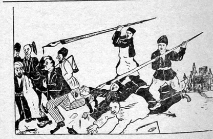
ایلیجی-کندلی مخبرلریمیزک قریل قلماریله اداره و تشکلاتلارمزدان قوالاتان چنویونک بیروقنلار خصوصی اوزریجلی و موللا خان و کلر.

ولادیمیر ایلیچ دیردی که، ایلیجی مطبوعات قیالنه فارسی ایا ریلان مبارزه ده ایشجیلر انده کتله ایشتی سلاح او لد ایچون آجاتق پرولدتاریک دو شونجه سیه آزاد اولمالیدر. مطبوعات پرولدتاریک دیکتاتورسی اسولک بیر ویندی اولمالیدر. بو نامشیه ولادیمیر ایلیچ بوروزآریا ناطریقه مناشیه کیرشدره ک ۱۹۰۵ نچی ایله «فرقه تشکلیاتی و فرقه مطبوعاتی» سزولولدی طاقه یازیر: «یول کاشینی اوزرینه فورولوش جمعیت ایچنده بولونان و یوقولوق ایچنده ایشان زحمتکیش کتله لری اورادا ایلمان موه خور بدسته زنگتیلر منجیلده حقیق «آزادلیک» اول بیلیمو. طاقه یازان ادیپردن عیجا سز بوروزآریا صاحب لریگدن سزیک بوروزآریا اوخو چیلرکدن آرادیمیزک، بولار سزمن طلب ایبرلرکله داک سزچومولر آرسنا