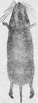
عادی چول سیجانی

اک عادی اوللار قیما قیروقی غا دی چول سیجانلارید. چول سیجانی چوق وقت تالارلاردا باشار، اونا عسنادہ مشہ فرخالریندا راست کلمک اولور. چول سیجانی تون بولسنی علیہندہ ۳۰ دن - ۸۰ سانی مرو درننگدہ ر آئندا یاییر. بو بولنگ کورب قیضاق ایچون دیشکری وارد. سیجان بوا سنک همین دیشکریدن سوای تاخل دانلری، اولج یاراق، یونجا و غیر ی نانات سالماق ایچون آتارلاری دخی وارد. یاز قاقی بو سیجانلار انسان مزیلرینہ باقاراق تون اوللاری اوت یغلاری آئندا، تاخیل تالارلاردا و آتارلارک مناسب برلرندہ یاییرلر. بو سیجانلاریک برقی قیضاق دانلار و اوقق فاللار ۱۰ درجہ ساووق داتاراق شرر ویریلر.