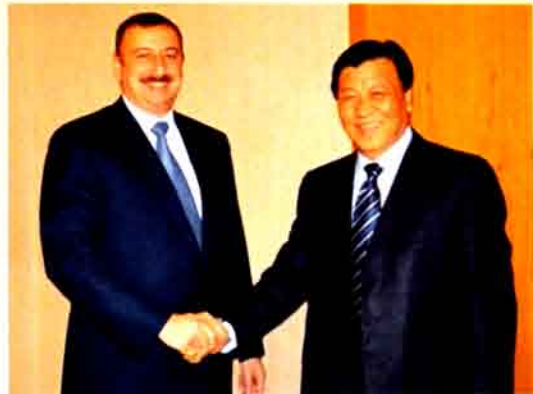
Heydər Əliyev Çin xalqının böyük dostu, Çin və Azərbaycan arasında uzunmüddətli və möhkəm dostluq münasibətlərinin yaranmasında böyük amarı olmuş dünyada tanınan siyasi xadimlərdən biridir.

Heydər Əliyevə öz ehtiramımı bildirirəm.